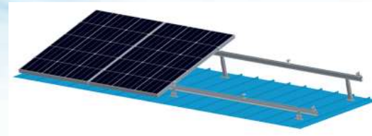
Sistema de Montaje