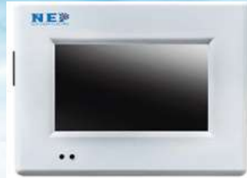
Sistema de Monitoreo